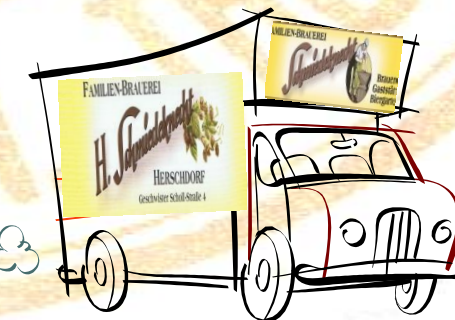
Ausliefern + Genießen!!!